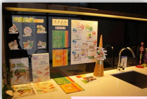
鼓勵周圍身邊的持份者關注健康